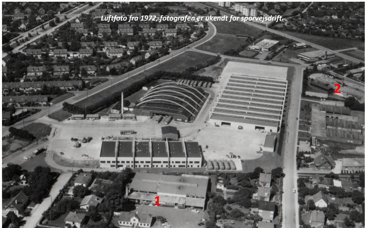
Luftfoto fra 1972, fotografen er ukendt for sporvejsdrift.

m x 56,4 m = 7.535 m 2 , Klargøringshal med kontorer 71,7 m x 27,4 m = 1.965 m 2 , Trafikbygning 24,6 m x 7,8 m = 192 m 2