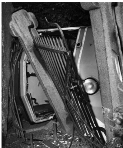
Fronten af sporvognen ramte lågen indtil Kirkegården